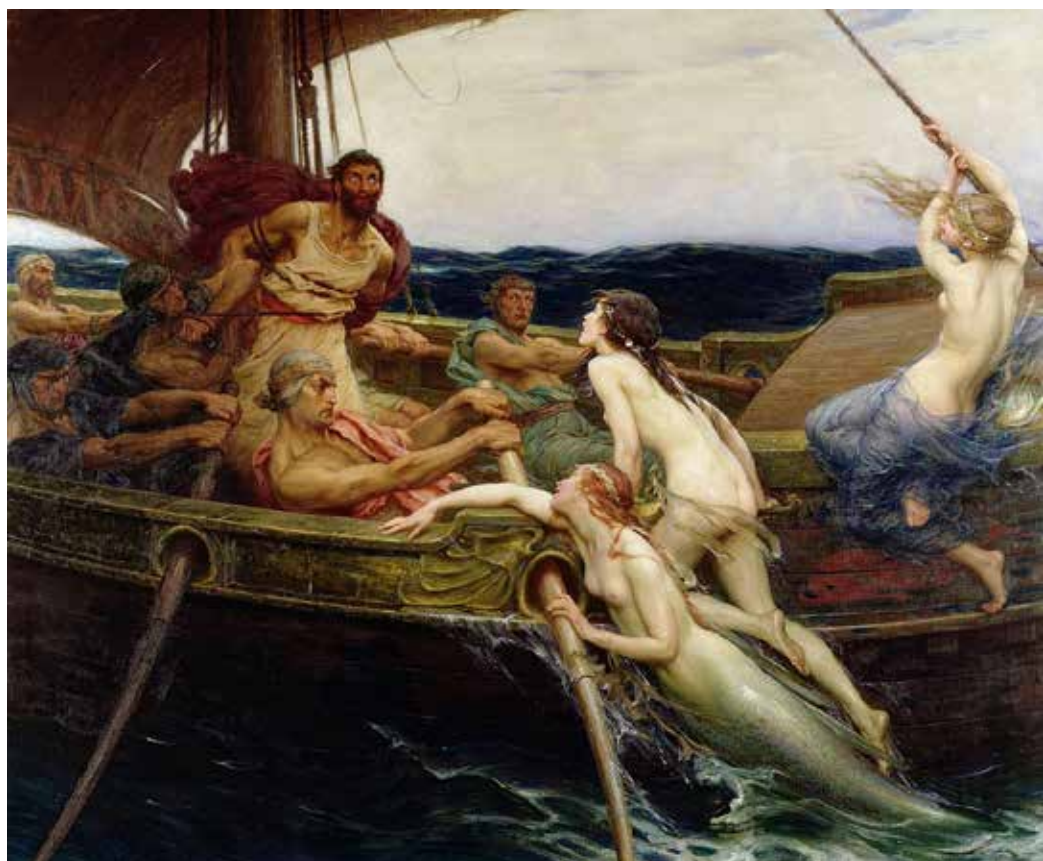
Ulysses and the Sirens , © Herbert James Draper (1864–1920)