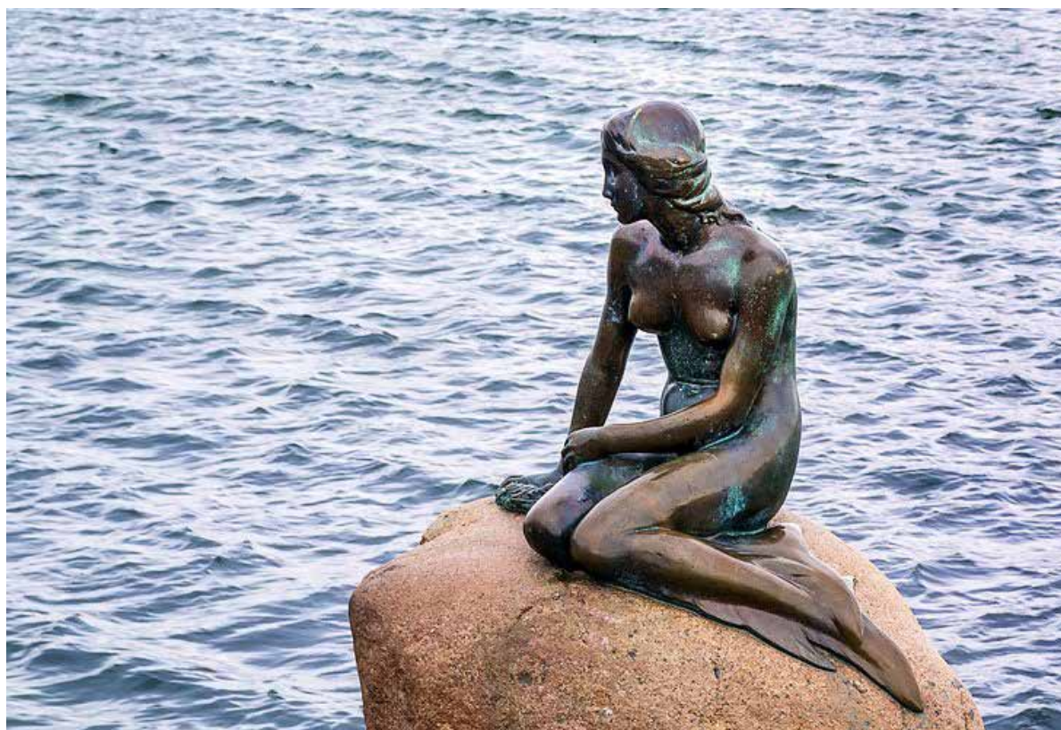
La statue de la Petite Sirène à Copenhague

Véritable symbole de la ville de Copenhague, cette statue se trouve sur les quais de Langelinje et accueille depuis 1913 les voyageurs au port de Copenhague. Cette statue en bronze fait référence au personnage de la petite sirène du conte de fées écrit en 1837 par l'écrivain danois Hans Christian Andersen. Pour sa réalisation, le sculpteur Edvard Eriksen s'est inspiré de la danseuse étoile Ellen Price qui, en 1909, a interprété le rôle de la Petite Sirène au Royal Theatre de Copenhague. C'est la femme du sculpteur, Eline Eriksen qui a été le modèle pour cette œuvre.