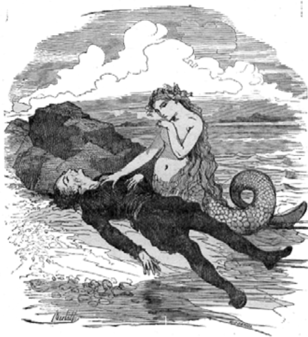
La Petite Sirène , illustration de Bertall.

La petite sirène est un être sans pied mais pourvu d'une queue de poisson qui vit dans l'océan avec sa famille. Elle est passionnée par le monde d'en haut celui des humains et rêve de marcher sur terre à leurs côtés. Un soir, elle découvre un grand navire avec un jeune prince à son bord. Une tempête éclate, le bateau coule et le prince se débat dans l'eau pour ne pas se noyer. La petite sirène vient à son secours et le dépose sur une plage où il est recueilli par des jeunes filles. Elle regagne alors tristement le fond de l'océan. Elle rêve de devenir humaine et éternelle grâce à l'amour d'un homme. Une sorcière lui propose son aide en échange de sa voix. Cette transformation sera définitive et mortelle si le prince ne l'épouse pas. Désormais humaine, la petite sirène retrouve le prince qui l'invite dans son palais. Malheureusement, il est amoureux d'une autre. Il décide d'épouser cette dernière et condamne la petite sirène à mourir. Ses sœurs tentent de la sauver en voulant tuer le prince, mais la petite sirène refuse car elle veut donner sa vie pour l'amour du prince. Elle se jette à l'eau et se transforme en ange.