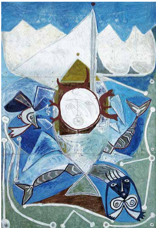
Ulysse et les sirènes , Pablo Picasso